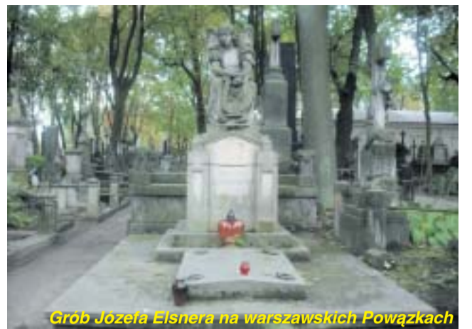
Grób Józefa Elsnera na warszawskich Powązkach