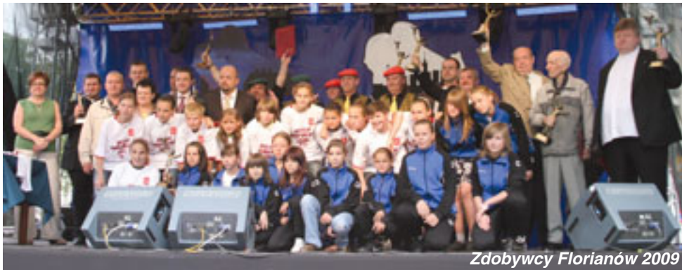
Zdobywcy Florianów 2009