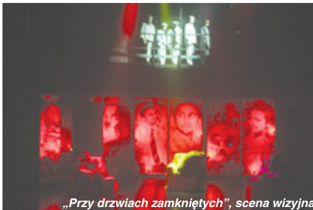
„Przy drzwiach zamkniętych”, scena wizyjna