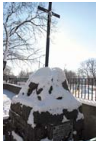
zdjęcie nr 2