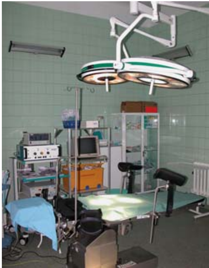
Sala operacyjna po nowemu: na górnym zdjęciu nowa lampa i nowoczesny stół porodowy. Poniżej - nowoczesny aparat do narkozy i monitorowania funkcji życiowych podczas operacji

nowoczesne oddziały. W tym roku – jak publicznie obiecał dyr. Janiak – oddział ma dostać nowe USG (taki aparat, jakiego potrzebuje oddział, kosztuje ponad 300 tys. zł). Remonty w całym szpitalu będą trwać nadal – tylko na te cele z Biura Polityki Zdrowotnej szpital dostał w tym roku 1,6 mln zł. ET