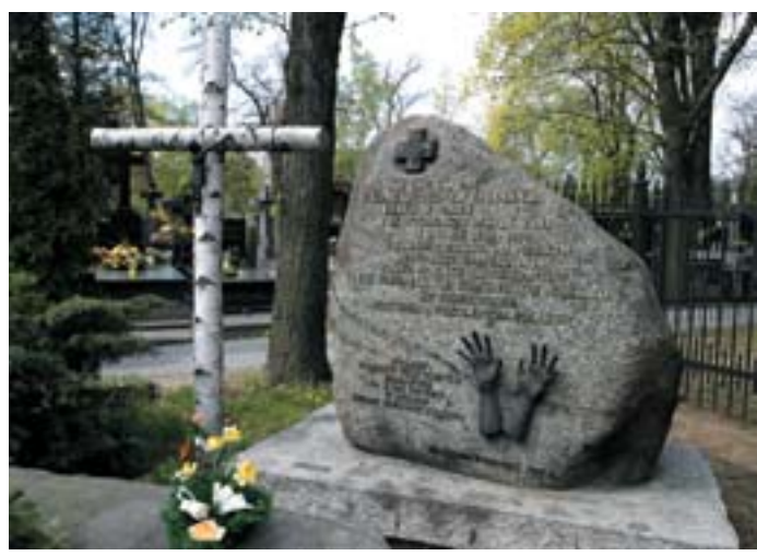
zdjęcie nr 4