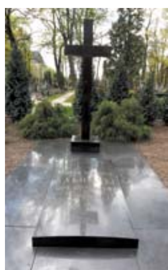
zdjęcie nr 3