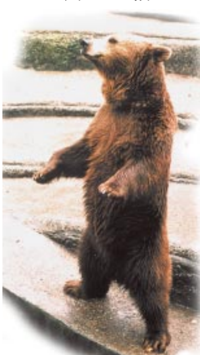
Gdy są na wybiegu najczęściej proszą nas o jabłka