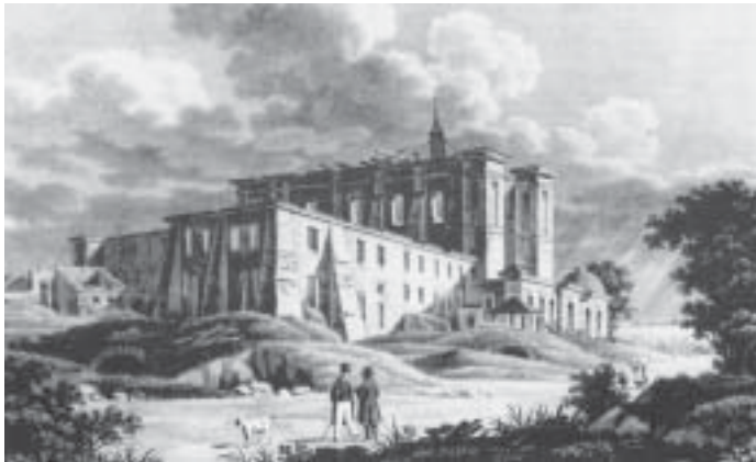
rok 1811 - na zdjęciu u góry widok kościoła i klasztoru OO Bernardynów na Pradze podczas rozbiórki - poniżej wewnątrz kaplicy Loretańskiej

Kres istnienia kościoła i klasztoru bernardynów położyła decyzja budowy twierdzy na Pradze w okresie napoleońskim. Zostały one rozebrane w 1811 roku i tylko stanowcza postawa mieszkańców Pragi zapobiegła rozbiórce kaplicy loretańskiej. Samą figurę MB Loretańskiej bernardyni przenieśli do swojej świątyni Św. Anny przy Krakowskim Przedmieściu, gdzie umieszczona została w specjalnie wybudowanej dla niej kaplicy. Do domu loretańskiego sprowadzona została gotycka, XV-wieczna fi-